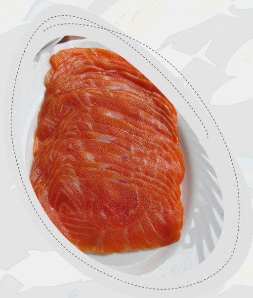
Figura 5: Filé reconstituído de salmão defumado a frio.

3.2. DEFUMAÇÃO A FRIO: técnica similar à defumação a quente, a diferença consiste na utilização de temperaturas mais baixas (15 – 30°C) por 24 horas até vários dias.