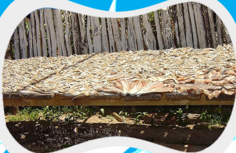
Figura 3: Secagem natural de pescado