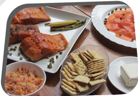
Figura 1: Produtos à base de salmão defumado

A importância da inclusão do pescado na dieta tem sido ainda enfatizada a respeito da diversidade de espécies e seus atributos sensoriais únicos.