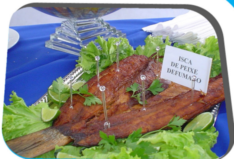
Figura 7: Corvina espalmada e defumada a quente.