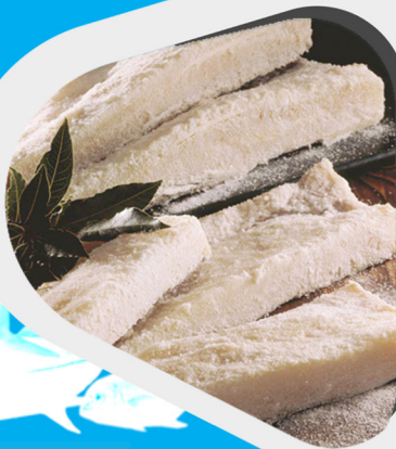
Figura 2: Pescado seco-salgado

“O pescado para a salga deve apresentar uma qualidade elevada, assim como o sal, para resultar em produto adequado para o consumo.”