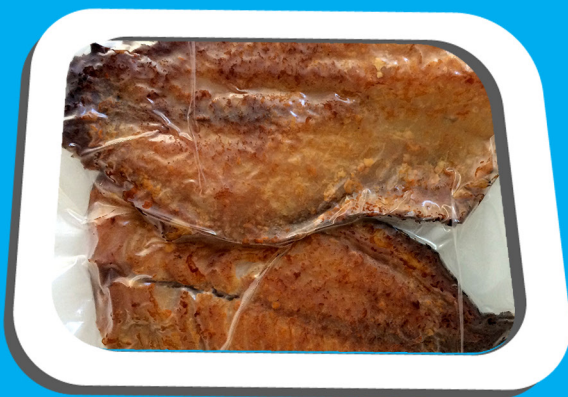
Figura 6: Filés de tilápia defumada embalada a vácuo.

Depois de removido do defumador, o produto deve esfriar antes de ser embalado. Durante o período de resfriamento, o pescado continua perdendo peso e, se for embalado ainda quente, poderá adquirir um aspecto úmido e textura amolecida, além de favorecer o crescimento de mofo sobre o produto.