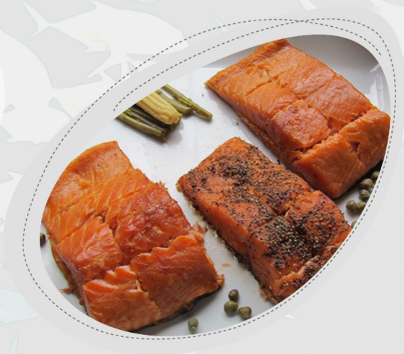
Figura 4: Postas de salmão defumado a quente.

3.2. DEFUMAÇÃO A FRIO: técnica similar à defumação a quente, a diferença consiste na utilização de temperaturas mais baixas (15 – 30°C) por 24 horas até vários dias.